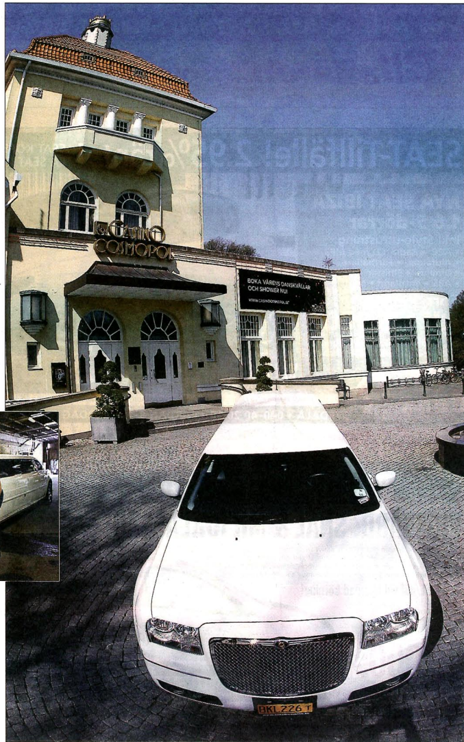
KUNGLIGT TILL KUNGSPARKEN. Rätt miljö för en lyxlimousine – kasinot i Kungsparken i Malmö.

Bränsleförbrukning: 1,2 liter/mil. Transmission: Automatladda, bakhjuldriven. Prestanda: Toppfart 160–170 km/lin. Kostnad: Det kostar cirka 1 500 kronor per timme att hyra en limousine i samband med till exempel en bröllopskörning.