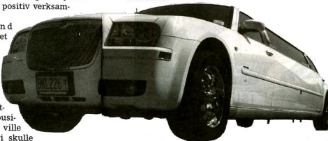
FLAGSKEPPE. Onekligen en majestätisk bil – Chrysler 300 C Stretch Limousine från 2008, ett av flaggskeppen i Elite Limousines vagnpark.